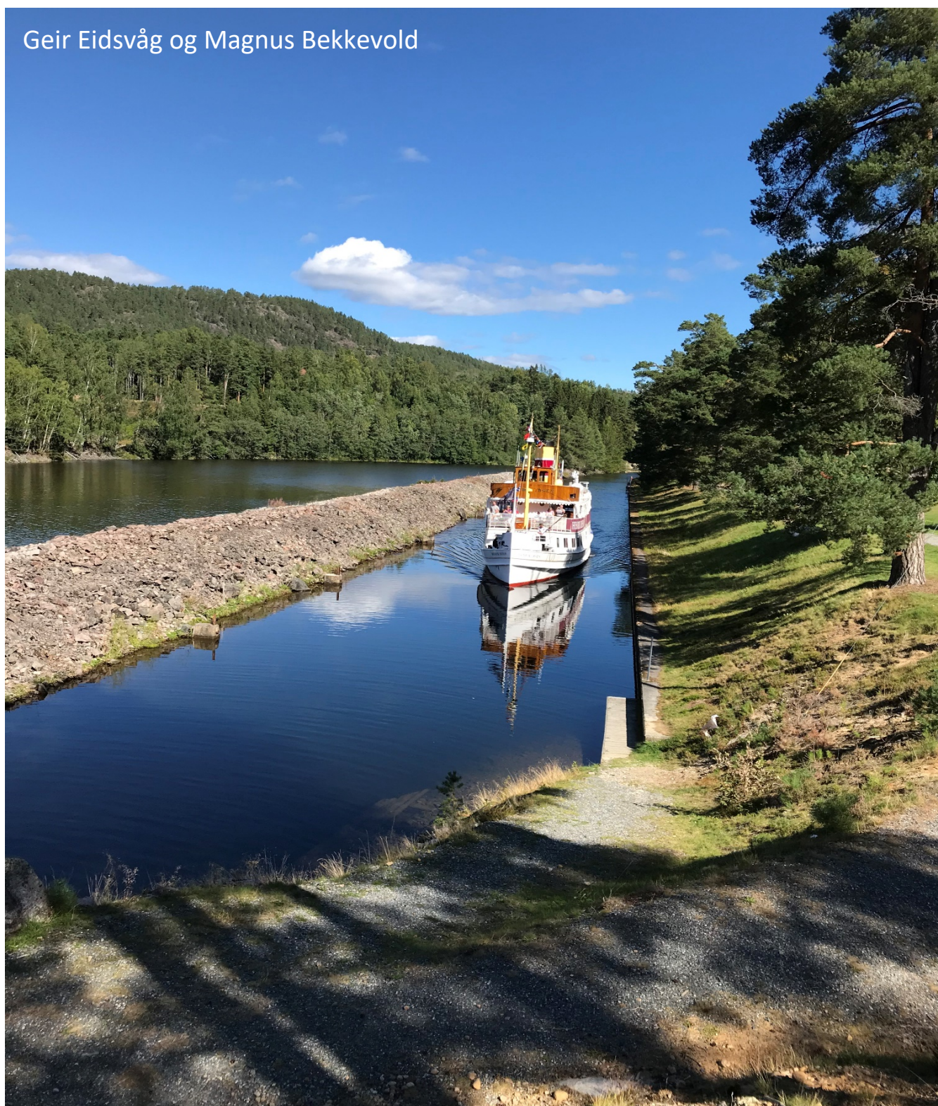
Telemarks kanalen, Kjeldal sluse.