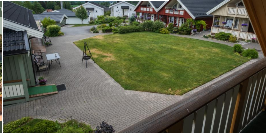
I ViveNova bor beboerne sammen, men hver for seg. Til venstre i bildet er felleshuset, som også leies ut til selskaper.